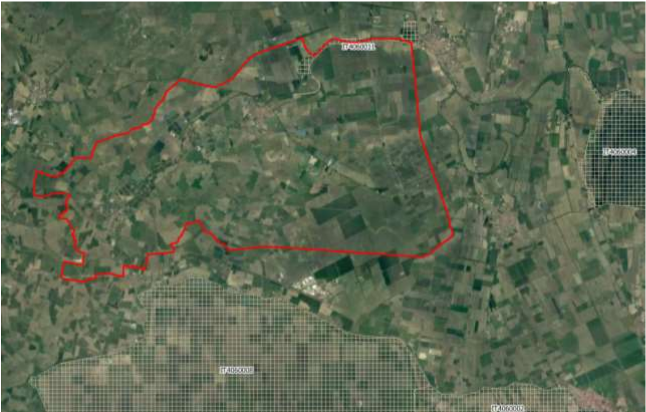
Figura 2-1: Posizione di Fiscaglia rispetto ai siti della Rete Natura

Inoltre a sud, esternamente a Fiscaglia ed entro i confini dei comuni di Argenta, Comacchio, Ostellato, Portomaggiore è presente il sito IT4060008 – ZPS -Valle del Mezzano, che si trova nei comuni di Argenta, Comacchio, Ostellato, Portomaggiore e ricada parzialmente nel Parco Regionale Delta del Po. L'ente gestore è l'Ente di gestione per il Parchi e la Biodiversità – Delta del Po avente sede presso la sede del Parco Regionale Delta del Po a Comacchio.